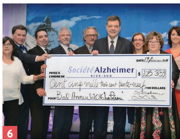
1,2,3,4,5 Bal « La cordillère des Andes, le Pérou ». 6 Plus de 105 000 $ amassés lors du Bal 2016.